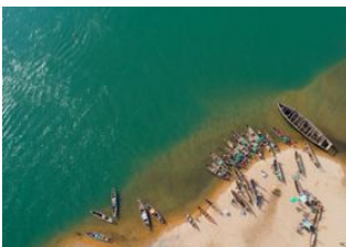
Porto Novo 📍