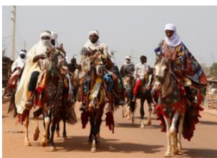
Tanguieta 📍 🚗 310km - ⌚ 4h 30m Nikki 📍