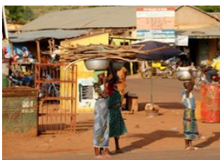
Boukoumbe 📍 🚗 60km - ⌚ 1h 30m Tanguieta 📍