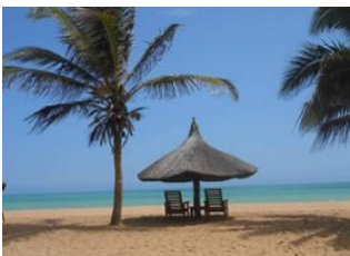
Abomey 📍 🚗 150km - ⌚ 2h 20m Grand-Popo 📍