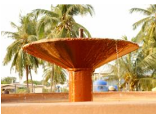
Grand-Popo 📍 🚗 40km - ⌚ 50m Possotome 📍