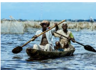
Cotonou 30km - 40m Ganvie