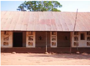
Natitingou 📍 🚗 465km - ⌚ 6h 50m Abomey 📍